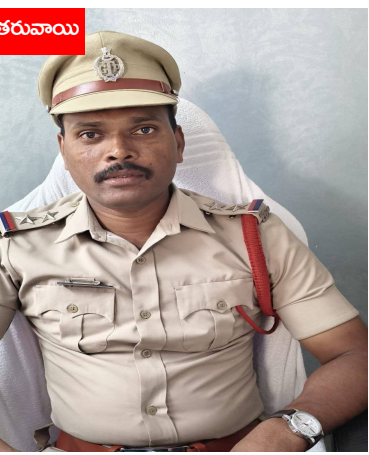
మెదటి పేజీ తరువాయి