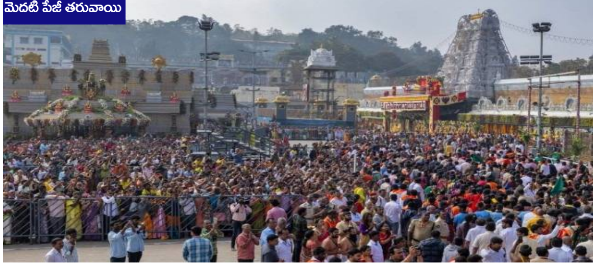
మెదటి పేజీ తరువాయి

విక్రయించింది. భక్తుల అవసరాలకు అనుగుణంగా లడ్డూల తయారీ, పంపిణీ ప్రక్రియను అధికారులు నిరంతరం పర్యవేక్షిస్తూ సరఫరాలో ఎలాంటి అంతరాయం లేకుండా చర్యలు తీసుకుంటున్నారు. అన్నప్రసాద భవనాల్లో 2.58 లక్షల మంది భక్తులకు ఉచిత భోజన సదుపాయం కల్పించినట్లు టీటీడీ తెలిపింది. భక్తులకు పరిశుభ్రమైన, నాణ్యమైన ఆహారం అందించేందుకు ప్రత్యేక చర్యలు చేపట్టినట్లు అధికారులు పేర్కొన్నారు. తిరుమలకు వచ్చే ప్రతి భక్తికి అన్నప్రసాదం అందించాలనే లక్ష్యంతో ఏర్పాట్లు కొనసాగు తున్నాయి. అదేవిధంగా తిరుమలలో వైద్య సేవలు కూడా నిరంతరం అందుబాటులో ఉంచారు. సోమవారం 3,172 మంది భక్తులకు వైద్య సేవలు అందించినట్లు టీటీడీ వెల్లడించింది. భక్తుల రద్దీ దృష్ట్యా దర్శనం, వసతి, ప్రసాదం, వైద్యం తదితర అన్ని సేవలను మరింత సమర్థవంతంగా నిర్వహించేందుకు అధికారులు ప్రత్యేక చర్యలు చేపడుతున్నారు.