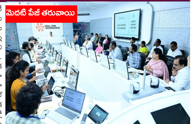
మెదటి పేజీ తరువాయి