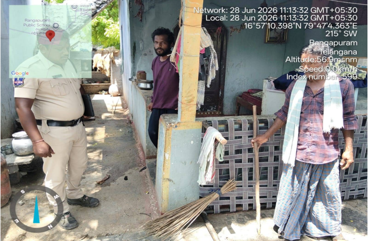
జిల్లా ఎస్సీ నరసింహ ఐపిఎస్ అదేకాలంతో క్షేత్ర స్థాయి అధికారుల పర్యవేక్షణ నిరంతరంగా కొనసాగుతుంది. గడిచిన ఆదివారం (జూన్ 28) ఒక్కరోజే జిల్లా వ్యాప్తంగా 'డయల్ 100' ద్వారా పోలీసులకు 90 ఫిర్యాదులు అందాయి. ఈ ఫిర్యాదులపై సూర్యాపేట జిల్లా పోలీసులు అత్యంత వేగంగా స్పందించారు. ఫోన్ కాల్ వచ్చిన వెంటనే నగటున కేవలం 5.12 నిమిషాల వ్యవధిలోనే రెస్పాన్స్ టీమ్ బాధితుల వద్దకు చేరుకొని తగిన సహాయం అందించాయి. జిల్లాలో డయల్ 100 పిర్యాదులపై బ్లూ కోట్స్, పెట్రో కార్ సిబ్బంది నిరంతరం క్షేత్రస్థాయిలో పటిష్టంగా పనిచేస్తున్నారు. ఏ చిన్న సమస్య వచ్చినా వెంటనే ఘటనా స్థలానికి చేరుకునేలా ఈ బృందాలు ఎల్లప్పుడూ అప్రమత్తంగా ఉంటున్నాయి. సిబ్బంది పనితీరును, జిల్లాలోని భద్రతా పరిస్థితులను పోలీస్ ఉన్నతాధికారులు నిరంతరం పర్యవేక్షిస్తున్నారు. ప్రజల భద్రతకు అత్యున్నత ప్రాధాన్యతనిస్తూ, ఎలాంటి అత్యవసర పరిస్థితిలోనైనా పోలీసు సేవలను వినియోగించుకోవాలని అధికారులు ఈ సందర్భంగా ప్రజలకు విజ్ఞప్తి చేశారు.

మన ప్రజాప్రతినిధి తెలుగు దినపత్రిక సూర్యాపేట జిల్లా :సూర్యాపేట జిల్లా పోలీస్ సెలవు దినాల్లోనూ నిరంతరంగా సూర్యాపేట జిల్లా పోలీసుల సేవలు. ఆదివారం రోజున 90 డయల్ 100 కాల్స్, నగటున 5.12 నిమిషాల్లో బాధితుల వద్దకు వెళ్లిన పోలీసులు. సూర్యాపేట ప్రజల రక్షణే ధ్యేయంగా సూర్యాపేట జిల్లా పోలీస్ యంత్రాంగం నిరంతరం అప్రమత్తంగా వ్యవహరిస్తోంది. ప్రజల భద్రత, రక్షణే ప్రథమ కర్తవ్యంగా సెలవు దినాల్లోనూ సైతం రాత్రి పగలు తేడా లేకుండా ప్రజలకు అందుబాటులో ఉంటూ రక్షణ కల్పిస్తోంది. జిల్లా ఎస్సీ నరసింహ ఐపిఎస్ అదేకాలంతో క్షేత్ర స్థాయి అధికారుల పర్యవేక్షణ నిరంతరంగా కొనసాగుతుంది. గడిచిన ఆదివారం (జూన్ 28) ఒక్కరోజే జిల్లా వ్యాప్తంగా 'డయల్ 100' ద్వారా పోలీసులకు 90 ఫిర్యాదులు అందాయి. ఈ ఫిర్యాదులపై సూర్యాపేట జిల్లా పోలీసులు అత్యంత వేగంగా స్పందించారు. ఫోన్ కాల్ వచ్చిన వెంటనే నగటున కేవలం 5.12 నిమిషాల వ్యవధిలోనే రెస్పాన్స్ టీమ్ బాధితుల వద్దకు చేరుకొని తగిన సహాయం అందించాయి. జిల్లాలో డయల్ 100 పిర్యాదులపై బ్లూ కోట్స్, పెట్రో కార్ సిబ్బంది నిరంతరం క్షేత్రస్థాయిలో పటిష్టంగా పనిచేస్తున్నారు. ఏ చిన్న సమస్య వచ్చినా వెంటనే ఘటనా స్థలానికి చేరుకునేలా ఈ బృందాలు ఎల్లప్పుడూ అప్రమత్తంగా ఉంటున్నాయి. సిబ్బంది పనితీరును, జిల్లాలోని భద్రతా పరిస్థితులను పోలీస్ ఉన్నతాధికారులు నిరంతరం పర్యవేక్షిస్తున్నారు. ప్రజల భద్రతకు అత్యున్నత ప్రాధాన్యతనిస్తూ, ఎలాంటి అత్యవసర పరిస్థితిలోనైనా పోలీసు సేవలను వినియోగించుకోవాలని అధికారులు ఈ సందర్భంగా ప్రజలకు విజ్ఞప్తి చేశారు.