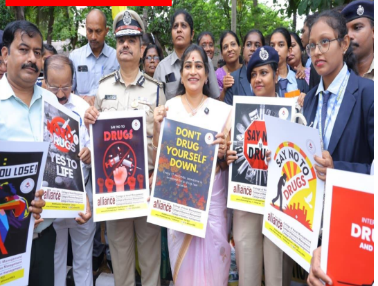
మెదటి పేజీ తరువాయి

ఇప్పటికే వ్యసనాల బారినపడిన వారిని తిరిగి సాధారణ జీవితంలోకి తీసుకురావడం ప్రభుత్వ ప్రధాన లక్ష్యమని అన్నారు. వారికి అత్యవసానం కల్పించి, సమాజంలో గౌరవప్రదమైన జీవితం గడిపేలా చేయడంలో ప్రభుత్వం పూర్తి సహకారం అందిస్తుందని తెలిపారు. దేశంలోనే తొలిసారిగా మత్తు విమోచన వారికి పునరావాసంతో పాటు ఉపాధి అవకాశాలను కల్పించే సమగ్ర కార్యక్రమాన్ని విశాఖ సీటీ పోలీసులు ప్రారంభించడం అభినందనీయమని మంత్రి పేర్కొన్నారు. వ్యసనాల నుంచి బయటపడిన వారికి వైపుబాధిపట్టి, ఉపాధి కల్పన, సామాజిక పునరావాసం వంటి అంశాలపై ప్రత్యేక దృష్టి సారీసావని వెల్లడించారు. మత్తు పదార్థాల నిర్మూలన కోసం రాష్ట్ర ప్రభుత్వం కఠిన చర్యలు తీసుకుంటోందని, అదే సమయంలో బాధితులను సమాజంలో తిరిగి నిలబెట్టేందుకు మానవీయ దృక్పథంతో కార్యక్రమాలు చేపడుతోందని మంత్రి చెప్పారు. యువత మత్తు వ్యసనాలకు దూరంగా ఉండేలా విస్తృత అవగాహన కార్యక్రమాలు నిర్వహించాలని పోలీసు శాఖకు సూచించారు. విశాఖపట్నం పోలీసు కమిషనర్ శంఖుబ్రత బాగ్చి మాట్లాడుతూ, మిషన్ జ్యోతిర్గమయ ద్వారా మత్తు వ్యసనాల నుంచి బయటపడిన వారికి అవసరమైన వైద్య, మానసిక, సామాజిక సహాయంతో పాటు ఉపాధి అవకాశాలు కల్పించేందుకు ప్రత్యేక కార్యాచరణ రూపొందించినట్లు తెలిపారు. బాధితులు తిరిగి వ్యసనాల బారిన పడకుండా నిరంతర పర్యవేక్షణ కూడా ఉంటుందని వివరించారు. మత్తు రహిత ఆంధ్రప్రదేశ్ లక్ష్య సాధనలో ప్రజల సహకారం ఎంతో అవసరమని మంత్రి అనిత విలుపునిచ్చారు. కుటుంబ సంఘాలు, విద్యాసంస్థలు, స్వచ్ఛంద సంస్థలు, పోలీసు శాఖ సమీక్షిగా పనిచేస్తేనే మత్తు వ్యసనాలను పూర్తిగా నిర్మూలించగలమని ఆమె పేర్కొన్నారు. 'మిషన్ జ్యోతిర్గమయ' రాష్ట్రానికి ఆదర్శప్రాయమైన కార్యక్రమంగా నిలుస్తుందని ఆశాభావం వ్యక్తం చేశారు.