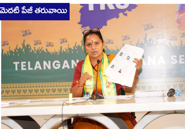
మెదటి పేజీ తరువాయి

వ్యత్యాసానికి కారణమేంటో ఎన్నికల సంఘం ప్రజలకు వివరించాలని కోరారు. ఓటర్లను తొలగించే ముందు ఎన్నికల నిబంధనల ప్రకారం నోటీసులు జారీ చేశారా లేదా అన్న విషయాన్ని కూడా వెల్లడించాలని డిమాండ్ చేశారు. ఇంటర్ స్టేట్ డూబ్లికేట్ ఓటర్లను గుర్తించి తొలగించే వ్యవస్థ ఎన్నికల సంఘం వద్ద ఉందా లేదా అన్నది స్పష్టం చేయాలని కవిత అన్నారు. అలాంటి వ్యవస్థ లేకపోతే భారీ వ్యయంతో నిర్వహిస్తున్న ఎన్ఐఐఆర్ ప్రక్రియ వల్ల ఆశించిన ఫలితాలు రావని అభిప్రాయపడ్డారు. దేశవ్యాప్తంగా ఒక వ్యక్తి ఒకే ఓటు ఉండే విధంగా 'పన్ నేషనల్ ఓటు' విధానాన్ని అమలు చేయాల్సిన అవసరం ఉందని సూచించారు. దేశంలో రాష్ట్రాల మధ్య వలసలు, సంచార జాతుల ఓటర్ల సమోదయ, డూబ్లికేట్ ఓటర్ల నివారణ వంటి అంశాలపై ఎన్నికల సంఘం శాశ్వత విధానాన్ని రూపొందించాలని కవిత కోరారు. ఎన్ఐఐఆర్ ప్రక్రియ కేవలం పేరుకే కాకుండా దేశవ్యాప్తంగా పారదర్శక ఓటరు జాబితాల రూపకల్పనకు ఉపయోగపడాలని అన్నారు. ప్రతి అర్హుడికి ఓటు హక్కు ఉండేలా, ఒకే వ్యక్తికి రెండు చోట్ల ఓటు ఉండకుండా సమర్థవంతమైన వ్యవస్థను ఏర్పాటు చేయాలని సూచించారు. కొత్త రాజకీయ పార్టీగా తమకు స్వేచ్ఛాయుత, పారదర్శక ఎన్నికలు అత్యంత ముఖ్యమని కవిత పేర్కొన్నారు. తాము లేవనెత్తిన అన్ని ప్రశ్నలకు ఎన్నికల సంఘం సమగ్ర సమాధానం ఇవ్వాలని విజ్ఞప్తి చేశారు. ఓటరు జాబితాల తయారీపై ప్రజల్లో ఎలాంటి సందేహాలు లేకుండా పూర్తి పారదర్శకతతో వ్యవహరించాలని, ఎన్నికల ప్రక్రియపై విశ్వాసాన్ని మరింత బలోపేతం చేసే చర్యలు తీసుకోవాలని ఆమె కోరారు.