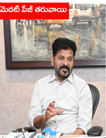
మెదటి పేజీ తరువాయి