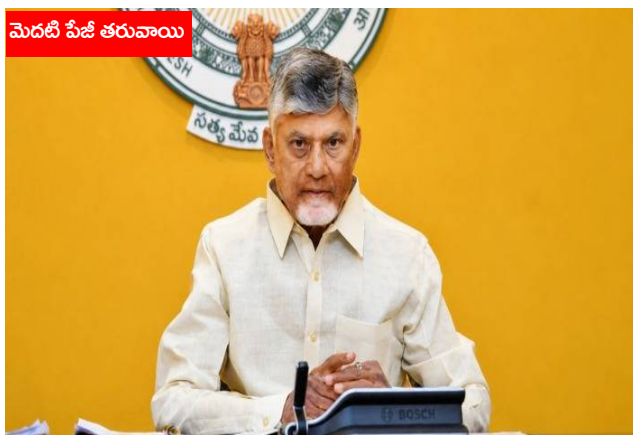
మెదటి పేజీ తరువాయి

అవసరమైన మౌలిక సదుపాయాలు, అనుమతులు వేగంగా అందించేందుకు ప్రభుత్వం కట్టుబడి ఉందని తెలిపారు. పారిశ్రామిక ప్రగతి ద్వారా ఉపాధి, ఆదాయ అవకాశాలు పెరిగి రాష్ట్ర ఆర్థిక వ్యవస్థకు మరింత బలం చేకూరుతుందని వివరించారు. జియోమైన్సూర్ సర్వీసెస్ డెక్కన్ గోల్డ్ మైన్స్ సంస్థ విస్తరణతో గనుల రంగంలో ఆధునిక సాంకేతికత వినియోగం పెరగడంతో పాటు ఉత్పాదకత కూడా మెరుగుపడుతుందని సంస్థ ప్రతినిధులు వెల్లడించారు. స్థానిక ప్రాంతాల అభివృద్ధికి కూడా తమ వంతు సహకారం అందిస్తామని పేర్కొన్నారు. ఈ కార్యక్రమంలో ప్రజాప్రతినిధులు, వివిధ శాఖల అధికారులు, సంస్థ ప్రతినిధులు, పారిశ్రామికవేత్తలు, స్థానిక నాయకులు, ఉద్యోగులు పెద్ద సంఖ్యలో పాల్గొన్నారు. జొన్నగిరిలో కొత్త యూనిట్ ప్రారంభం కర్నూలు జిల్లాలో పారిశ్రామిక రంగ విస్తరణకు కొత్త ఊపునిస్తుందని పలువురు అభిప్రాయపడ్డారు.