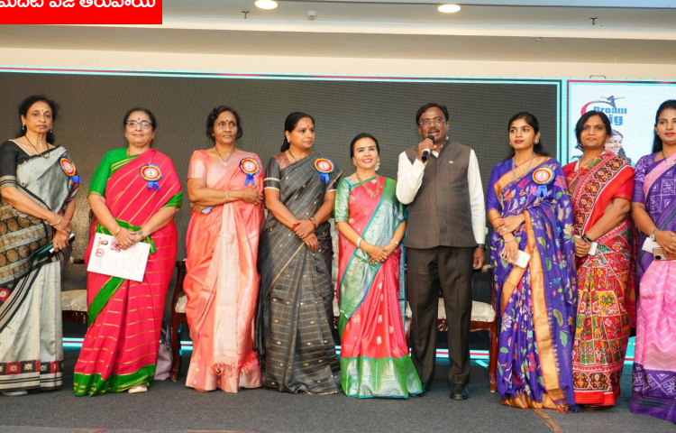
మెదటి పేజీ తరువాయి