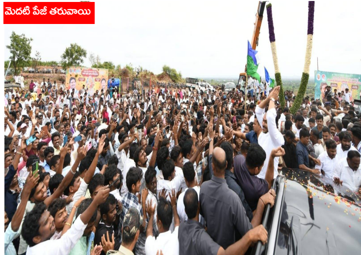
మెదటి పేజీ తరువాయి

ప్రత్యేక ఏర్పాట్లు చేశారు. ఈ కార్యక్రమంలో వైఎస్సార్ కాంగ్రెస్ పార్టీ నాయకులు, ప్రజాప్రతినిధులు, స్థానిక నాయకులు, ఆలయ కమిటీ సభ్యులు, గ్రామ పెద్దలు, భక్తులు పెద్ద సంఖ్యలో పాల్గొన్నారు. భూమియ్యగారిపల్లెలో గట్టు శ్రీలక్ష్మీనరసింహస్వామి ఆలయ ప్రారంభోత్సవం గ్రామంలో పండుగ వాతావరణాన్ని తీసుకొచ్చింది.