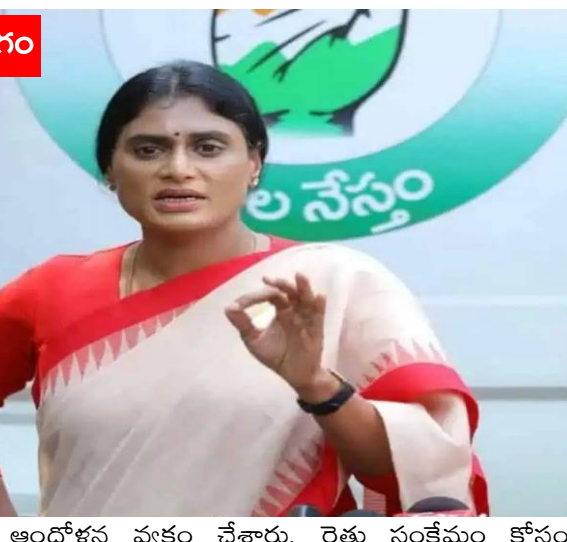
తరువాయి భాగం ఆందోళన వ్యక్తం చేశారు. రైతు సంక్షేమం కోసం పథకాలు అమలు చేస్తున్నామని ప్రభుత్వం చెబుతున్నప్పటికీ రైతుల ఆత్మహత్యలు ఎందుకు కొనసాగుతున్నాయో వివరించాలని డిమాండ్ చేశారు. వ్యవసాయ రంగంలో ఎదురవుతున్న సవాళ్లకు సమర్థవంతమైన పరిష్కారాలు చూపడంలో కేంద్రం విఫలమైందని ఆరోపించారు. విభజన రాజకీయాలపై కూడా భారతీయ జనతా పార్టీని ఆమె విమర్శించారు. మత, సామాజిక విభేదాలను రెచ్చగొట్టే రాజకీయాలు దేశానికి మంచివి కావని పేర్కొన్నారు. ప్రజల సమస్యల పరిష్కారమే కాంగ్రెస్ లక్ష్యమని, రాష్ట్ర అభివృద్ధి కోసం తమ పార్టీ అంకితభావంతో పనిచేస్తుందని, ప్రజా ఉద్యమాల తరఫున తమ పోరాటం కొనసాగుతుందని షర్మిల స్పష్టం చేశారు.

వ్యాఖ్యలను ఖండిస్తూ కేంద్ర ప్రభుత్వ పన్నెండేళ్ల పాలనలో జరిగిన వైఫల్యాలపై సమాధానం చెప్పాలని సవాల్ విసిరారు. ఈ మేరకు గురువారం ఆమె ఒక ప్రకటన విడుదల చేశారు. రాజ్యసభ సీటు అనేది మాట ఇచ్చిన వారికి, తీసుకున్న వారికి సంబంధించిన అంశమని, దీనిపై భారతీయ జనతా పార్టీ నేతలు స్పందించడం వెనుక కారణం ఏమిటని ప్రశ్నించారు. ప్రజా సమస్యలు, ప్రభుత్వ వైఫల్యాలపై ప్రశ్నిస్తుంటే సమాధానాలు చెప్పలేక ఇతర అంశాలను ప్రస్తావిస్తూ దృష్టి మళ్లించే ప్రయత్నం జరుగుతోందని ఆరోపించారు. కాంగ్రెస్ పార్టీ లేవనెత్తిన పన్నెండు ప్రధాన అంశాలపై చర్చకు సిద్ధమా అని కేంద్ర ప్రభుత్వాన్ని షర్మిల ప్రశ్నించారు. నిత్యావసర వస్తువుల ధరలు భారీగా పెరగడం, నిరుద్యోగ సమస్య, పరీక్షా పత్రాల లీకేజీలు, మహిళలపై జరుగుతున్న నేరాల వంటి అంశాలపై ప్రజలకు స్పష్టమైన సమాధానాలు ఇవ్వాలని డిమాండ్ చేశారు. దేశ ఆర్థిక పరిస్థితిపై కూడా ఆమె విమర్శలు గుప్పించారు. కేంద్ర ప్రభుత్వం తీసుకున్న భారీ అప్పులు ఎక్కడ ఖర్చు చేశారో శ్వేతపత్రం విడుదల చేయాలని కోరారు. దేశ ఆర్థికాభివృద్ధిపై గొప్పలు చెప్పుకుంటున్న ప్రభుత్వం రూపాయి విలువ క్షీణితమై ఎందుకు స్పందించడం లేదని ప్రశ్నించారు. రైతుల సమస్యలపై కూడా షర్మిల