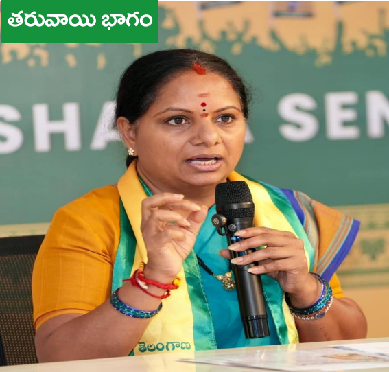
తరువాయి భాగం ఈ విషయంపై ఎన్నికల సంఘం దృష్టికి తమ వాదనలను తీసుకెళ్లినట్లు సమాచారం. ఈ పరిణామాల నేపథ్యంలో కవిత తరపు ప్రతినిధులు త్వరలో ఎన్నికల సంఘాన్ని కలిసి తమ వాదనలను వినిపించేందుకు సిద్ధమవుతున్నారు. ఒకే పేరుపై వివిధ వర్గాల నుంచి అభ్యంతరాలు వ్యక్తమవుతున్న తరుణంలో తెలంగాణ రక్షణ సేనకు టీఆర్ఎస్ సంక్షిప్త నామం దక్కతుందా లేదా అన్నది రాజకీయ వర్గాల్లో ఆసక్తిగా మారింది.

అభ్యంతరాలు చేరుతున్నట్లు సమాచారం. ఈ వ్యవహారంలో భారత్ రాష్ట్ర సమితి తీవ్ర అభ్యంతరం వ్యక్తం చేసింది. టీఆర్ఎస్ అనే పేరు తెలంగాణ ఉద్యమ చరిత్రతో ముడిపడి ఉందని, ఉద్యమ కాలం నుంచి ప్రజల భావోద్వేగాలకు ప్రతీకగా నిలిచిందని పేర్కొంది. గ్రామీణ ప్రాంతాల్లో ఇప్పటికీ ప్రజలు తమ పార్టీని టీఆర్ఎస్ పేరుతోనే గుర్తిస్తున్నారని వాదిస్తూ, ఆ పేరును మరో రాజకీయ సంస్థకు కేటాయించరాదని ఎన్నికల సంఘాన్ని కోరింది. ఇదిలా ఉండగా, కవిత పార్టీ ప్రకటనకు ముందే మహారాష్ట్రలోని సోలాపూర్ కు చెందిన తెలంగాణ రాష్ట్రసామాజిక సేన అనే సంస్థ కూడా టీఆర్ఎస్ సంక్షిప్త నామం కోసం దరఖాస్తు చేసుకున్నట్లు సమాచారం వెలుగులోకి వచ్చింది. దీంతో ఈ పేరుపై పోటీ మరింత ఆసక్తికరంగా మారింది. అదే సమయంలో ప్రజల నుంచి కూడా పెద్ద సంఖ్యలో అభ్యంతరాలు ఎన్నికల సంఘానికి చేరినట్లు రాజకీయ వర్గాల్లో చర్చ జరుగుతోంది. పత్రికల్లో వచ్చిన ప్రకటనల ఆధారంగా వందల సంఖ్యలో అభ్యంతర పత్రాలు ఎన్నికల సంఘానికి అందినట్లు సమాచారం. దీంతో ఈ అంశం మరింత ప్రాధాన్యం సంతరించుకుంది. రాష్ట్ర ఎన్నికల సంఘం వద్ద ఇప్పటికే తెలంగాణ రాజ్య సమితి పేరుతో నమోదైన మరో రాజకీయ పార్టీ కూడా టీఆర్ఎస్ సంక్షిప్త నామం వినియోగంపై అభ్యంతరం వ్యక్తం చేసినట్లు తెలిసింది.