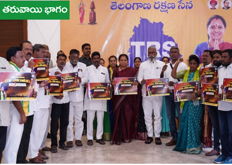
తరువాయి భాగం ఉద్యమకారులకు న్యాయం జరగాలని కోరుకునే ప్రతి ఒక్కరూ పెద్ద సంఖ్యలో పాల్గొనాలని విజ్ఞప్తి చేశారు. ముఖ్యంగా యువత, మహిళలు ఈ కార్యక్రమంలో చురుకుగా పాల్గొనాలని కవిత విలుపునిచ్చారు. తెలంగాణ కోసం ఉద్యమకారులు తమ జీవితాలను అంకితం చేశారని, వారికి న్యాయం జరిగేలా జరిగే ఈ కార్యక్రమంలో ప్రజలంతా భాగస్వాములు కావాలని కోరారు.

ప్రాంతంలో భూపోరాట కార్యక్రమాన్ని నిర్వహించనున్నట్లు కవిత ప్రకటించారు. ఉద్యమకారులకు కేటాయించాలని నిర్ణయించిన భూముల విషయంలో ప్రభుత్వం నిర్లక్ష్యంగా వ్యవహరిస్తోందని ఆరోపించారు. ఇచ్చిన హామీ ప్రకారం ఉద్యమకారులకు భూములు కేటాయించాలని డిమాండ్ చేశారు. ఉద్యమకారులకు రెండువందల యాభై గజాల భూమి ఇస్తామని ప్రకటించినప్పటికీ ఇప్పటికీ అమలు జరగలేదని ఆమె విమర్శించారు. అర్హతైన ఉద్యమకారులను గుర్తించి వెంటనే భూములు అందజేయాలని ప్రభుత్వాన్ని కోరారు. తెలంగాణ ఆత్మగౌరవం, తెలంగాణ భావజాలంపై కొందరు దాడి చేస్తున్నారని కవిత ఆరోపించారు. తెలంగాణ స్ఫూర్తిని దెబ్బతీయడానికి కుట్రలు జరుగుతున్నాయని, వాటిని తిప్పికొట్టేందుకు ప్రజలు ఐక్యంగా ముందుకు రావాలని విలుపునిచ్చారు. జులై 2న నిర్వహించే భూపోరాట కార్యక్రమంలో విజయవంతం చేయడం ప్రతి తెలంగాణవాది బాధ్యత అని ఆమె పేర్కొన్నారు.