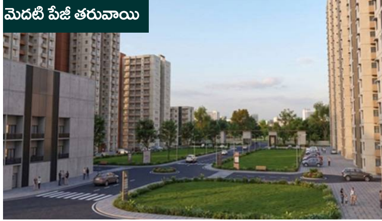
మెదటి పేజీ తరువాయి

నిర్మించనున్నారు. అలాగే దాదాపు రెండు వేల కార్లు నిలిపివేసేందుకు భూగర్భ వాహన పార్కింగ్ సదుపాయాన్ని ఏర్పాటు చేయనున్నారు. కేంద్ర ప్రభుత్వ ఉద్యోగులకు కార్యాలయాలకు సమీపంలోనే నాణ్యమైన నివాస సౌకర్యాలు కల్పించడం ఈ ప్రాజెక్టు ప్రధాన లక్ష్యం. ఉద్యోగులపై అద్దె భారం తగ్గడంతో పాటు కార్యాలయాలకు రాకపోకలు సులభతరం కానున్నాయి. దీంతో ఉద్యోగుల పనితీరు, సామర్థ్యం మరింత మెరుగుపడుతుందని కేంద్ర ప్రభుత్వం భావిస్తోంది. ఈ ప్రాజెక్టును పర్యావరణహిత ప్రమాణాలకు అనుగుణంగా నిర్మించనున్నారు. విద్యుత్ పొదుపు, నీటి సంరక్షణ, స్థానిక నిర్మాణ సామగ్రి వినియోగం వంటి అంశాలకు ప్రత్యేక ప్రాధాన్యం ఇవ్వనున్నారు. నివాస సముదాయంలో బ్యాంకు, తపాలా కార్యాలయం, సామాజిక భవనం, ఆహార కేంద్రం, వాణిజ్య సముదాయం, అతిథి గృహం వంటి సకల సౌకర్యాలను ఏర్పాటు చేయనున్నారు. దివ్యాంగులకు అనుకూలంగా