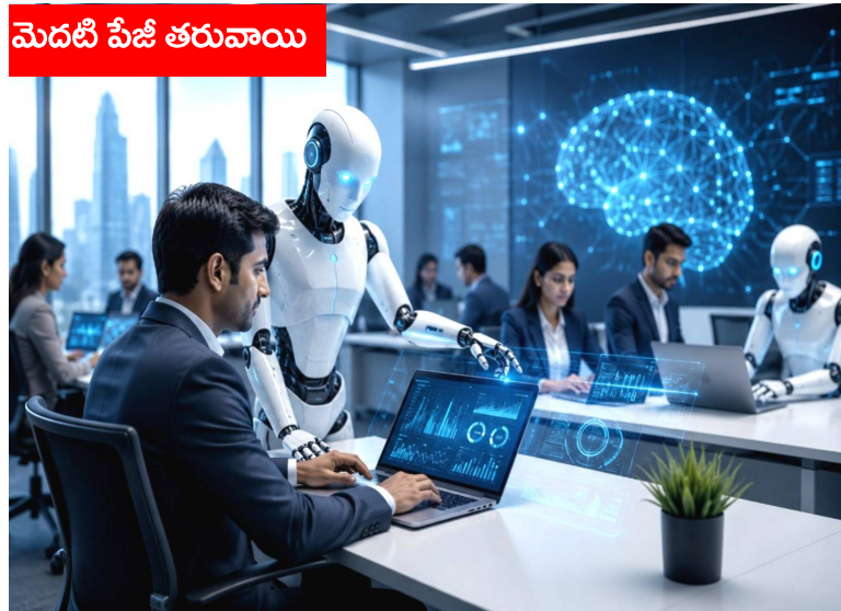
మెదటి పేజీ తరువాయి