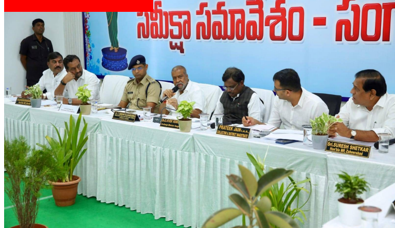
మెదటి పేజీ తరువాయి