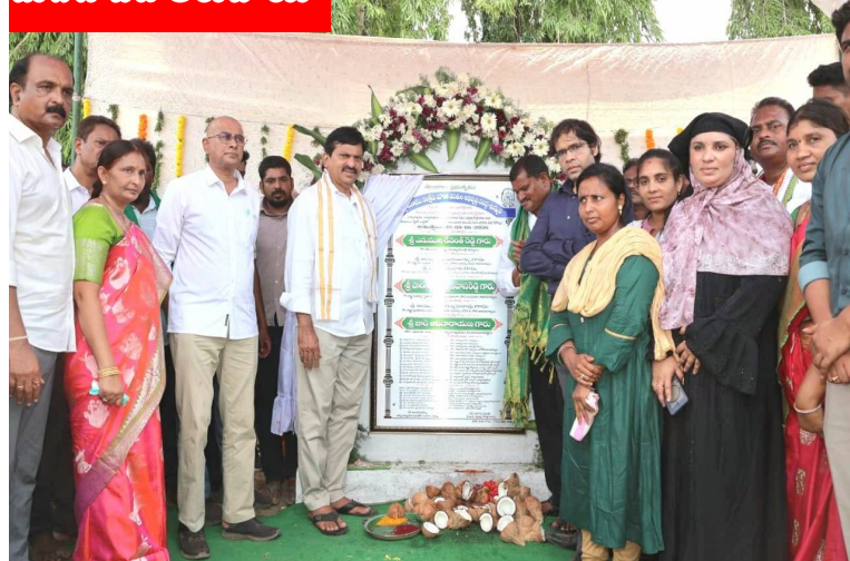
మెదటి పేజీ తరువాయి