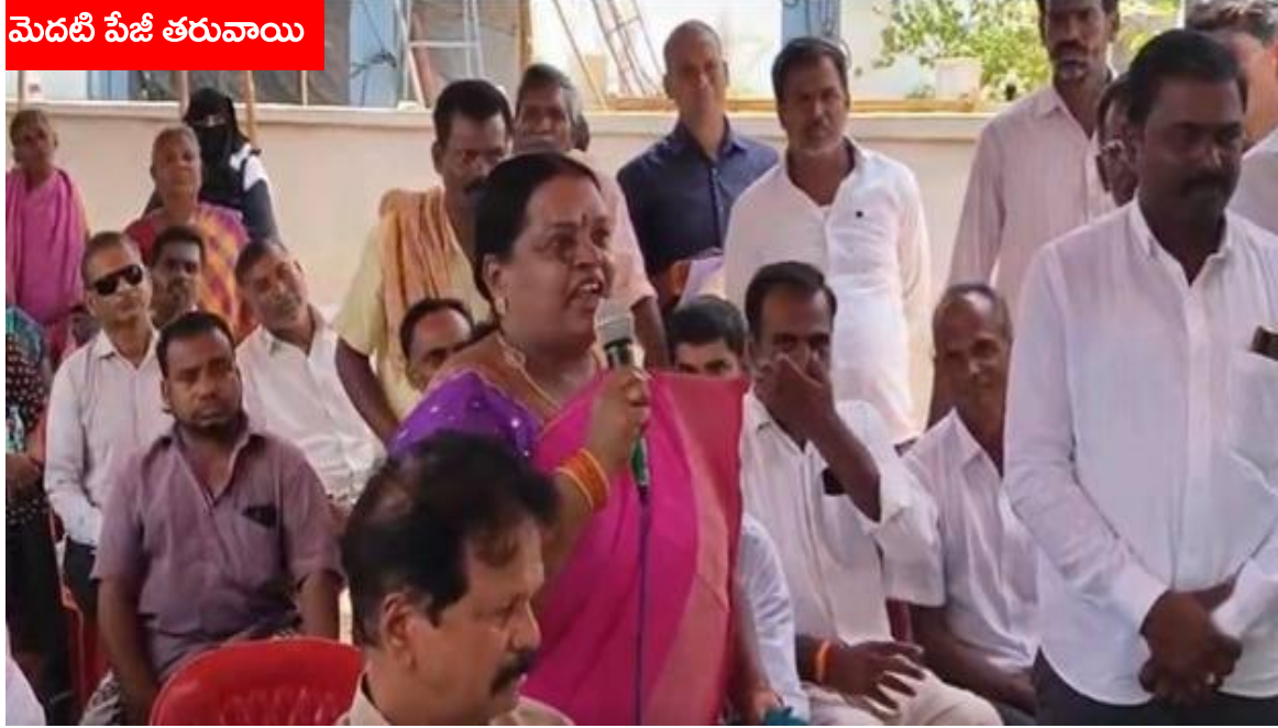
మెదటి పేజీ తరువాయి

మొత్తం మూడు వందల ఐదు ఎకరాల భూమిని సేకరించేందుకు సిద్ధమైంది. ఇందులో రెండు వందల తొమ్మిది ఎకరాల పట్టా భూమి, తొంభై ఆరు ఎకరాల ప్రభుత్వ భూమి ఉన్నట్లు అధికారులు తెలిపారు. ఈ భూసేకరణ కారణంగా నూట ముప్పై మూడు మంది పట్టా రైతులు, ముప్పై ఏడు మంది అసైన్డ్ భూమి రైతులు ప్రభావితమవుతున్నారు. ప్రజాభిప్రాయ సేకరణ కార్యక్రమంలో రైతులు తీవ్ర భావోద్వేగానికి గురయ్యారు. తమకు ఉన్న కొద్దిపాటి భూమిని కూడా ప్రభుత్వం తీసుకుంటే పిల్లలకు ఏమి ఇవ్వాలని ప్రశ్నించారు. ప్రభుత్వం ప్రకటిస్తున్న పరిహారం రేట్లతో తాము జీవించలేమని ఆవేదన వ్యక్తం చేశారు. భూమే తమ జీవనాధారమని, అది కోల్పోతే కుటుంబాలు రోడ్డున పడతాయని పేర్కొన్నారు. ఇండస్ట్రియల్ పార్క్ లో ఏ కంపెనీలు వస్తున్నాయో కూడా ప్రభుత్వం స్పష్టత ఇవ్వడం లేదని రైతులు ఆరోపించారు. పరిశ్రమలు వస్తే తమ ప్రాంతంలో కాలవ్యం పెరిగి వ్యవసాయం పూర్తిగా నాశనం అవుతుందని ఆందోళన వ్యక్తం చేశారు. పరిశ్రమల వల్ల భవిష్యత్ తరాలకు ఆరోగ్య సమస్యలు తలెత్తే ప్రమాదం ఉందని అన్నారు. చుట్టుపక్కల అనేక ప్రభుత్వ భూములు ఖాళీగా ఉన్నాయని, అక్కడ పరిశ్రమలు ఏర్పాటు చేసుకోవాలని రైతులు అధికారులను కోరారు. తమ భూములను వదిలేయాలని వేడుకున్నారు. భూములు కోల్పోతే గ్రామాల ఆర్థిక పరిస్థితి దెబ్బతింటుందని, వ్యవసాయంపై ఆధారపడిన కుటుంబాలు తీవ్ర ఇబ్బందులు ఎదుర్కొంటాయని తెలిపారు. రైతుల ఆందోళనల మధ్య అధికారులు భూసేకరణ ప్రక్రియపై వివరాలు వెల్లడించారు. ప్రభుత్వం నిబంధనల ప్రకారం పరిహారం అందిస్తుందని హామీ ఇచ్చారు. అయినప్పటికీ రైతులు తమ భూములను కాపాడుకోవాలనే పట్టుదలతో ఉన్నారు. ఈ భూసేకరణ అంశం ప్రస్తుతం జిల్లాలో తీవ్ర చర్చనీయాంశంగా మారింది