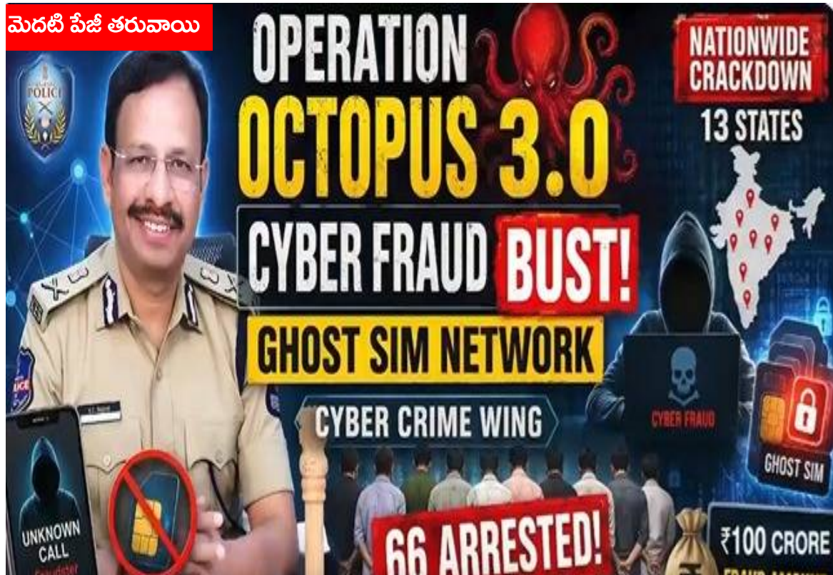
మెదటి పేజీ తరువాయి

వాషింగ్టన్, 19 మే (మనప్రజాప్రతినిధి): భారత్ కీలక రక్షణ ఒప్పందాలకు అమెరికా విదేశాంగ శాఖ అమోదం తెలిపినట్లు సమాచారం. సుమారు నాలుగు వేల కోట్ల రూపాయల విలువైన రెండు ప్రధాన సైనిక ఒప్పందాలకు అనుమతి లభించినట్లు తెలుస్తోంది. ఈ ఒప్పందం ద్వారా భారతదేశం అమెరికా నుంచి అపాచీ హెలికాప్టర్లకు సంబంధించిన సేవలు, అల్ట్రా లైట్ హోవిజ్జర్ల వ్యవస్థలకు మద్దతు పొందనుంది. ఈ ఒప్పందంలో భాగంగా అపాచీ హెలికాప్టర్ల సపోర్ట్ సేవల కోసం దాదాపు పందొమ్మిది కోట్ల ఎన్నబై లక్షల డాలర్లు ఖర్చు చేయనున్నారు. అలాగే అల్ట్రా లైట్ హోవిజ్జర్ల వ్యవస్థల నిర్వహణ, సేవల కోసం ఇరవై మూడు కోట్ల డాలర్లు కేటాయించనున్నారు. ఈ ఒప్పందాల ద్వారా భారత సైనిక సామర్థ్యాలు మరింత బలోపేతం అవుతాయని అమెరికా విదేశాంగ శాఖ అభిప్రాయపడింది. అపాచీ ప్యాకేజీ అమలులో టోయింగ్, లాక్ హింద్ మార్షల్ సంస్థలు కలిసి పనిచేయనున్నాయి. హోవిజ్జర్ల వ్యవస్థల కోసం బీఏఈ సిస్టమ్స్ సాంకేతిక సహకారం అందించనుంది. రక్షణ