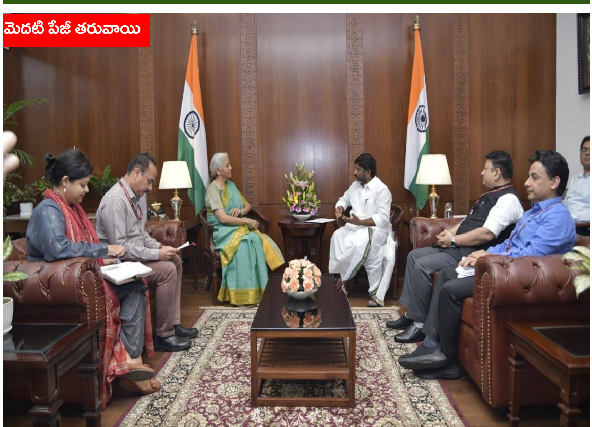
మెదటి పేజీ తరువాయి