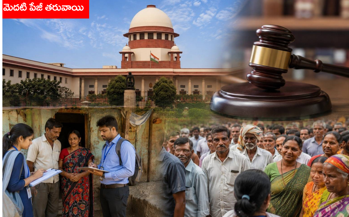
మెదటి పేజీ తరువాయి

వాషింగ్టన్, 19 మే (మనప్రజాప్రతినిధి): భారత్ కీలక రక్షణ ఒప్పందాలకు అమెరికా విదేశాంగ శాఖ అమోదం తెలిపినట్లు సమాచారం. సుమారు నాలుగు వేల కోట్ల రూపాయల విలువైన రెండు ప్రధాన సైనిక ఒప్పందాలకు అనుమతి లభించినట్లు తెలుస్తోంది. ఈ ఒప్పందం ద్వారా భారతదేశం అమెరికా నుంచి అపాచీ హెలికాప్టర్లకు సంబంధించిన సేవలు, అల్ట్రా లైట్ హోవిజ్జర్ల వ్యవస్థలకు మద్దతు పొందనుంది. ఈ ఒప్పందంలో భాగంగా అపాచీ హెలికాప్టర్ల సపోర్ట్ సేవల కోసం దాదాపు పందొమ్మిది కోట్ల ఎన్నబై లక్షల డాలర్లు ఖర్చు చేయనున్నారు. అలాగే అల్ట్రా లైట్ హోవిజ్జర్ల వ్యవస్థల నిర్వహణ, సేవల కోసం ఇరవై మూడు కోట్ల డాలర్లు కేటాయించనున్నారు. ఈ ఒప్పందాల ద్వారా భారత సైనిక సామర్థ్యాలు మరింత బలోపేతం అవుతాయని అమెరికా విదేశాంగ శాఖ అభిప్రాయపడింది. అపాచీ ప్యాకేజీ అమలులో టోయింగ్, లాక్ హింద్ మార్షల్ సంస్థలు కలిసి పనిచేయనున్నాయి. హోవిజ్జర్ల వ్యవస్థల కోసం బీఏఈ సిస్టమ్స్ సాంకేతిక సహకారం అందించనుంది. రక్షణ రంగంలో ఈ సంస్థలు ఇప్పటికే ప్రపంచవ్యాప్తంగా ప్రముఖ పాత్ర