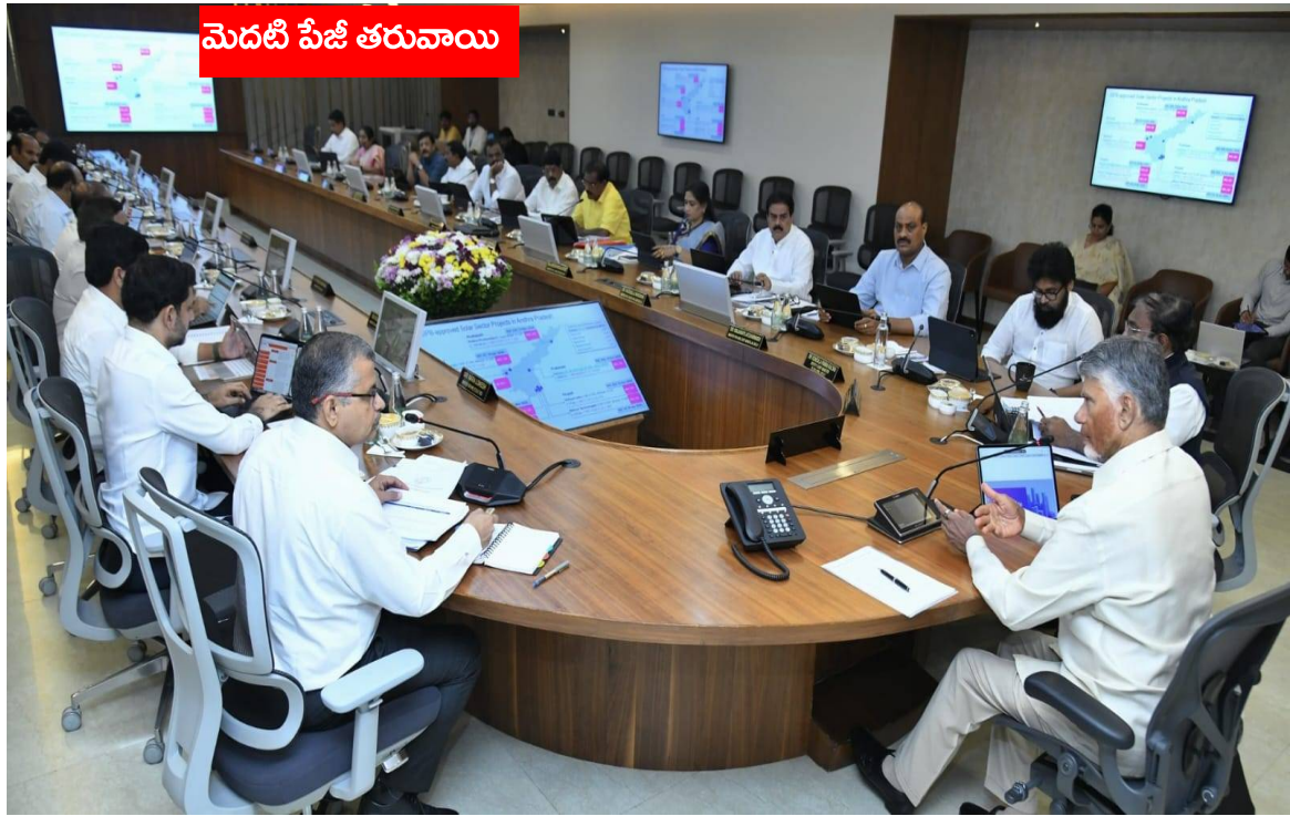
మెదటి పేజీ తరువాయి

సమీప ప్రాంతాలకు వెళ్లబుప్పుడు నడక, సైకిల్ వినయంగా ప్రోత్సహించాలని కోరారు. ప్రతి శుక్రవారం “నో వెహికల్ డే” పాటించాలని ప్రభుత్వం నిర్ణయించింది. ఆ రోజు వాహనాల వినయంగా తగ్గించి వర్షువల్ సమావేశాలు నిర్వహించాలని సూచించింది. అధికారులు వాహనాలను పేర్ చేసుకోవడం ద్వారా ఇంధనాన్ని ఆదా చేయాలని కోరారు. ప్రభుత్వ శాఖల్లో ఇంధన వినయంగా వారానికోసారి సమీక్ష నిర్వహించనున్నట్లు వెల్లడించారు. కొత్తగా కొనుగోలు చేసే వాహనాలు ఎలక్ట్రిక్ వాహనాలే ఉండాలని నిర్ణయించినట్లు తెలిపారు. ప్రజలు కూడా బాధ్యతగా వ్యవహరించాలని ప్రభుత్వం విజ్ఞప్తి చేసింది. విదేశీ చర్యలను బదులుగా స్వదేశీ పర్యాటకాన్ని ప్రోత్సహించాలని సూచించింది. బంగారం కొనుగోళ్లపై అధిక ఆసక్తిని తగ్గించుకోవాలని, దీనివల్ల విదేశీ మారక ద్రవ్యం ఆదా అవుతుందని పేర్కొన్నారు. “స్టైప్ ఫర్ ది నేషన్” పేరుతో నడక, సైకిల్ వినయంగా ప్రత్యేక ప్రచార కార్యక్రమాలు చేపట్టనున్నట్లు తెలిపారు. ఇంధన రంగంలో శిలాజ ఇంధనాలపై ఆధారాన్ని తగ్గించేందుకు పీఎం సూర్యభుర్ పథకం, పీఎం కుసుమ్ పథకం వంటి సౌర విద్యుత్ పథకాల