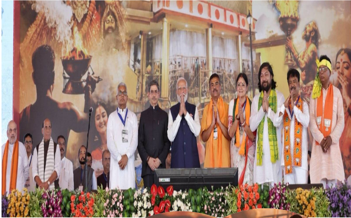
కోల్కతా, మే 9 (మనప్రజాప్రతినిధి):

పశ్చిమ బెంగాల్ రాజకీయాల్లో చారిత్రాత్మక మలుపు చోటుచేసుకుంది. భారతీయ జనతా పార్టీ తరపున తొలి ముఖ్యమంత్రిగా సువేండు అధికారి శనివారం ప్రమాణ స్వీకారం చేశారు. కోల్కతాలోని బ్రిగేడ్ పరేడ్ గ్రౌండ్ లో జరిగిన ఈ కార్యక్రమంలో రాష్ట్ర గవర్నర్ ఆర్ఎన్ రవి ఆయన చేత ప్రమాణ స్వీకారం చేయించారు. స్వాతంత్ర్యం తర్వాత బెంగాల్ లో బీజేపీ ప్రభుత్వం ఏర్పాటు కావడం రాష్ట్ర రాజకీయాల్లో కీలక పరిణామంగా మారింది. ఈ ప్రమాణ స్వీకార కార్యక్రమానికి ప్రధానమంత్రి నరేంద్ర మోదీతో పాటు కేంద్ర మంత్రులు, ఎన్డీపీ పాలిత రాష్ట్రాల ముఖ్యమంత్రులు, బీజేపీ జాతీయ నేతలు హాజరయ్యారు. కార్యక్రమం ప్రారంభానికి ముందే భారీగా పార్టీ కార్యకర్తలు, ప్రజలు అక్కడికి చేరుకున్నారు. బెంగాల్ రాజకీయాల్లో కొత్త అధ్యాయం ప్రారంభమైందంటూ బీజేపీ నేతలు వ్యాఖ్యానించారు. ప్రమాణ స్వీకారం అనంతరం సువేండు అధికారి ప్రధానమంత్రి మోదీ ఆశీస్సులు తీసుకున్నారు. వేదికపై ఉన్న జాతీయ నాయకులతో కరచాలనం చేశారు. బెంగాల్ అభివృద్ధి, పరిపాలనలో కొత్త దిశగా ముందుకు సాగుతామని ఆయన పేర్కొన్నారు. రాష్ట్ర ప్రజల విశ్వాసాన్ని నిలబెట్టుకునేందుకు కృషి చేస్తామని తెలిపారు. ఇటీవల ముగిసిన అసెంబ్లీ ఎన్నికల్లో బీజేపీ 294 స్థానాల్లో 207 స్థానాలు గెలుచుకుని ఘన విజయం సాధించింది. పదిహేనేళ్లుగా కొనసాగుతున్న తృణమూల్ కాంగ్రెస్ పాలనకు ఈ ఎన్నికలు ముగింపు పలికాయి. ముఖ్యమంత్రి మమతా బెనర్జీ ఆధిపత్యానికి గండి పడడంతో బెంగాల్ రాజకీయ సమీకరణాలు పూర్తిగా మారిపోయాయి. సువేండు అధికారి ప్రస్తుతం బెంగాల్ ముఖ్యమంత్రిగా