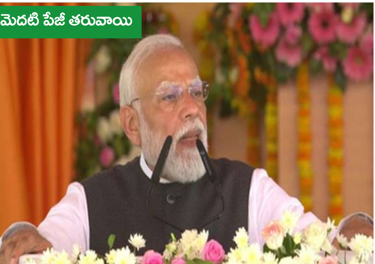
మెదటి పేజీ తరువాయి అభివృద్ధి చేయాలని ప్రణాళిక రూపొందించారు. దీంతో పరిశ్రమల పెట్టుబడులు పెరగడం, రైతులకు మెరుగైన మార్కెట్ అవకాశాలు లభించడం, వర్షాధారిత రంగం అభివృద్ధి చెందడం, ఉపాధి అవకాశాలు విస్తరించడం వంటి ప్రయోజనాలు లభిస్తాయని అధికారులు తెలిపారు. ఇతర ఎక్స్ ప్రెస్ వేలతో అనుసంధానం ద్వారా రాష్ట్రవ్యాప్తంగా సమగ్ర అభివృద్ధికి ఇది దోహదపడనుంది.

విశ్వనాథ అలయ దర్శనం తక్కువ సమయంలో సాధ్యమవుతుందని తెలిపారు. గతంలో గంటల తరబడి పట్టే ప్రయాణం ఇప్పుడు వేగవంతమవుతుందని చెప్పారు. ప్రజలకు సౌకర్యం పెరుగుతుందని వెల్లడించారు. ఈ గంగా ఎక్స్ ప్రెస్ వే మొత్తం 594 కిలోమీటర్ల పొడవుతో నిర్మితమైన అరు లేన్ నియంత్రిత గ్రీన్ ఫీల్డ్ రహదారి. భవిష్యత్తులో దీనిని ఎనిమిది లేన్లకు విస్తరించే అవకాశం ఉంది. ఇది మీరల్ నుంచి ప్రయాగ్ రాజ్ వరకు వస్తోంది. జిల్లా గుండా ప్రయాణిస్తూ రాష్ట్రంలోని పశ్చిమ, మధ్య, తూర్పు ప్రాంతాలను అనుసంధానిస్తుంది. ఈ రహదారి ద్వారా మీరల్ నుంచి ప్రయాగ్ రాజ్ మధ్య ప్రస్తుతం 10 నుంచి 12 గంటలు పట్టే ప్రయాణ సమయం కేవలం ఆరు గంటలకు తగ్గుతుంది. ఇది రవాణా రంగంలో పెద్ద మార్పుకు దారి తీస్తుందని అధికారులు తెలిపారు. ఈ ప్రాజెక్టులో భాగంగా షాజహాన్ పూర్ జిల్లాలో 3.5 కిలోమీటర్ల అత్యవసర విమాన దిగుబడి సౌకర్యాన్ని ఏర్పాటు చేశారు. ఇది రక్షణ అవసరాలకు కూడా ఉపయోగపడుతుంది. రహదారి వెంట పారిశ్రామిక కారిడార్లు, సరకు రవాణా కేంద్రాలు