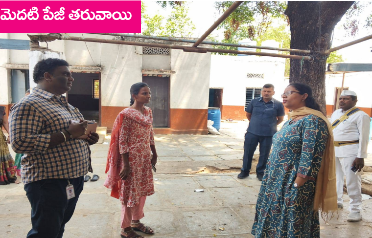
మెదటి పేజీ తరువాయి

కార్యక్రమాలను సమర్థవంతంగా అమలు చేసే ప్రతి చిన్నారి వరకు చేరేలా చూడాలని అధికారులను ఆదేశించారు. పిల్లల తల్లిదండ్రులతో కూడా సమన్వయం పెంచి, వారి ఆరోగ్యంపై అవగాహన కల్పించాలని సూచించారు. సమగ్ర పర్యవేక్షణతో సేవల నాణ్యతను పెంచాలని అన్నారు. ఈ పర్యటనలో సంబంధిత శాఖల అధికారులు, సిబ్బంది పాల్గొన్నారు. పిల్లల సంక్షేమంపై ఎప్పటికప్పుడు తనిఖీలు కొనసాగిస్తామని, ఎక్కడైనా లోపాలు తలెత్తితే కఠిన చర్యలు తప్పవని కలెక్టర్ హెచ్చరించారు. చిన్నారుల భవిష్యత్తు బలపడేలా సమిష్టి కృషి అవసరమని ఆమె పేర్కొన్నారు.