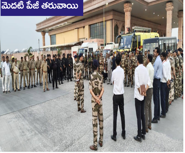
మెదటి పేజీ తరువాయి

పరిస్థితుల్లో స్పందన ఎలా ఉండాలి ప్రదర్శించాయి. ఉగ్రవాద పరిస్థితులను అనుకరించి నిర్వహించిన ఈ వ్యాయామంలో, అనుమానాస్పద కార్యకలాపాల గుర్తింపు, ప్రయాణికుల రక్షణ, పేలుడు పదార్థాల నిర్వహణ, అత్యవసర వైద్య సహాయం వంటి అంశాలపై ప్రత్యేకంగా దృష్టి సారించారు. ఈ మార్క్ డ్రైల్ ద్వారా బహుళ సంస్థల మధ్య సమన్వయం, వేగవంతమైన స్పందన, భద్రతా ప్రమాణాల అమలును అధికారులు సమీక్షించారు. ఎలాంటి ప్రమాద పరిస్థితుల్లోనైనా సమర్థవంతంగా స్పందించే సామర్థ్యాన్ని ఈ వ్యాయామం ద్వారా అంచనా వేశారు. విమానాశ్రయం భద్రతను మరింత బలోపేతం చేయడంలో ఈ తరహా మార్క్ డ్రైల్లు కీలకమని అధికారులు పేర్కొన్నారు. కీలక మౌలిక వసతులను రక్షించడంలో అప్రమత్తత, సమన్వయం అత్యంత అవసరమని స్పష్టం చేశారు.