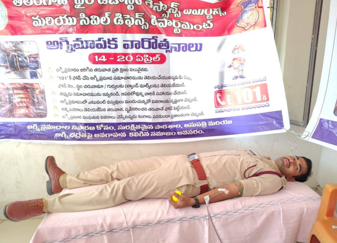
పాటించాల్సిన జాగ్రత్తలు, లీకేజీలు గుర్తించే విధానం, అత్యవసర పరిస్థితుల్లో తీసుకోవాల్సిన చర్యలపై వివరించారు. అలాగే విద్యుత్ భద్రతపై కూడా ప్రజలకు అవగాహన కల్పించారు. పాత వైరసు మార్చుకోవడం, ఓవర్లోడ్స్ నివారించడం, సరైన నాణ్యత గల ఎలక్ట్రికల్ పరికరాలను వినియోగించడం వంటి సూచనలు చేశారు. చిన్నపాటి నిర్లక్ష్యం కూడా పెద్ద ప్రమాదాలకు దారితీస్తుందని ఫైర్ సిబ్బంది హెచ్చరించారు. ఈ అవగాహన కార్యక్రమాలకు స్థానిక ప్రజలు మంచి స్పందన చూపించారు. ఫైర్ సర్వీస్ టీక్ సందర్భంగా నిర్వహిస్తున్న ఇలాంటి కార్యక్రమాలు ప్రజల్లో భద్రతపై చైతన్యం పెంచడంలో కీలక పాత్ర పోషిస్తున్నాయి.